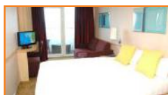
Καμπίνα με Μπαλκόνι