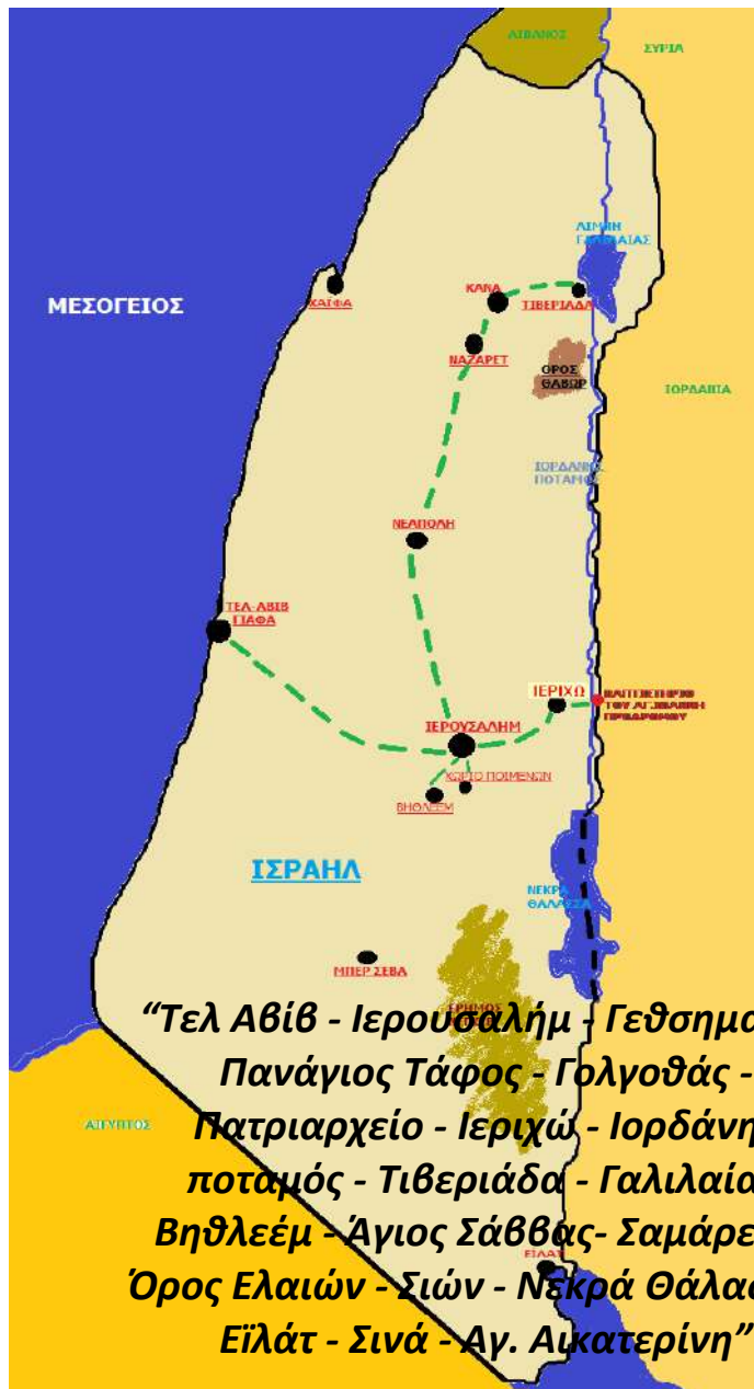
ΟΔΙΚΟΣ ΧΑΡΤΗΣ ΑΓ. ΤΟΠΩΝ