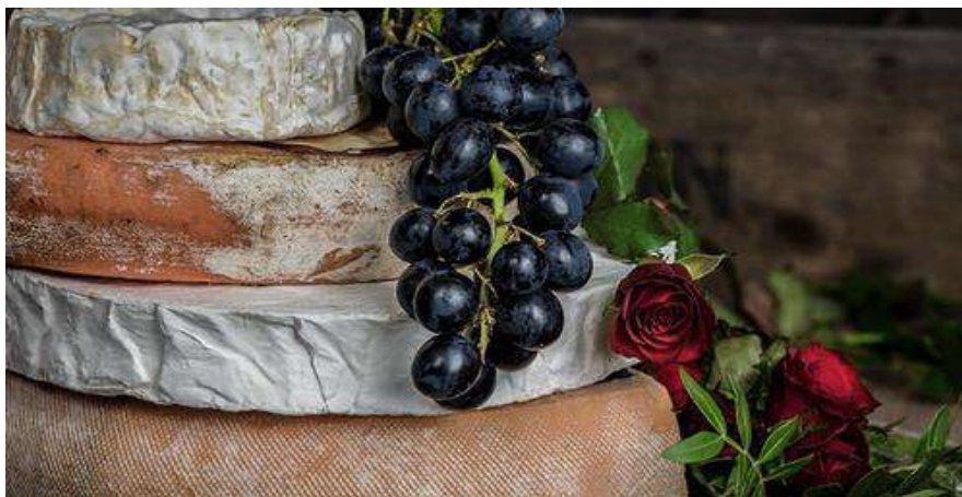
Για τους Γνώστες Εκλεκτών Καταστάσεων

Η απόλαυση καλού φαγητού και κρασιού δεν θα έπρεπε να είναι πολυτέλεια. Το πακέτο γκουρμέ έχει επιλεγεί προσεκτικά για άτομα με εκλεπτυσμένη γεύση.