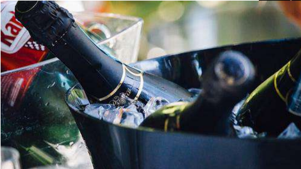
Στον Αφρό της Θάλασσας

Τίποτα δεν συμπληρώνει καλύτερα την ευτυχία από μία πινελιά πολυτέλειας. Όπως το να ξυπνάς το πρωί με ένα ποτήρι σαμπάνιας, ή ακόμα και ένα ποτήρι κάτω από τα αστέρια.