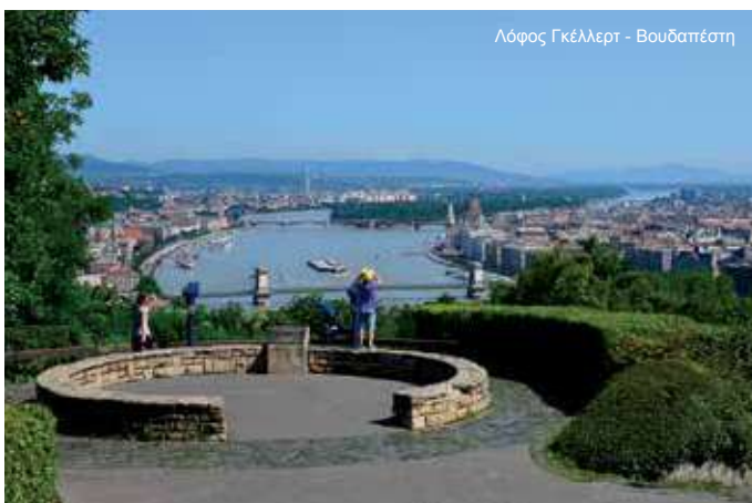
Λόφος Γκέλερτ - Βουδαπέστη

Πρωινό και χρόνος ελεύθερος στο κέντρο της πόλης για περίπατο ή επίσκεψη σε Μουσεία (Φυσικής Ιστορίας, Ιστορία της Τέχνης, Τετράγωνο Μουσείων, Μουσείο Θησαυρού κ.ά.) ή επίσκεψη στον εξαιρετικό ζωολογικό κήπο της Βιέννης. Κατόπιν, αναχώρηση για περιήγηση στα περίχωρα της Βιέννης, τα περίφημα Βιεννέζικα δάση, πηγή έμπνευσης για πολλούς καλλιτέχνες (Μπετόβεν, Μότσαρτ, Στράους κ.ά.). Πρώτα θα επισκεφθούμε το Μοναστήρι του Τιμίου Σταυρού και μετά στην τοποθεσία του Μάγιερλινγκ, θα δούμε το άλλοτε κυνηγετικό περίπτερο των Αψβούργων, γνωστό από τη θλιβερή όσο και ρομαντική ιστορία της αυτοκτονίας του διαδόχου πρίγκιπα Ροδόλφου και της Μαρίας Βετσέρα. Θα κλείσουμε την εκδρομή μας με επίσκεψη και περιήγηση στη γνωστή λουτρόπολη Μπάντεν. Ιδιαίτερα γνωστό το καζίνο της πόλης και το σπίτι όπου ο Μπετόβεν συνέθεσε την ενάτη συμφωνία, ωδή στη χαρά. Έπειτα επιστροφή στην Βιέννη