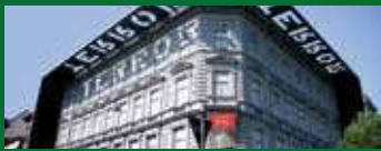
House of Terror η "Βουλή του Τρόμου"