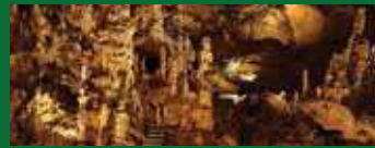
Ανακαλύψτε τον υπόγειο κόσμο της Βουδαπέστης