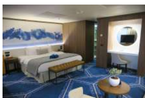
Grand Dream Σουίτα με μπαλκόνι κατηγορίας SG