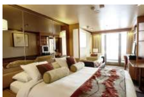
Junior Dream Σουίτα με μπαλκόνι κατηγορίας SJA