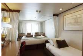
Εξωτερική με παράθυρο κατηγορίας XD