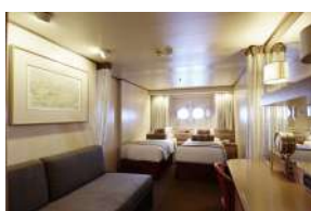
Εξωτερική με φινιστρίνι κατηγορίας XA