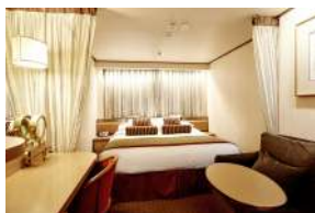
Εσωτερική κατηγορίας IC