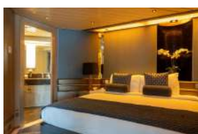
The Stargazer Σουίτα με μπαλκόνι κατηγορίας SP