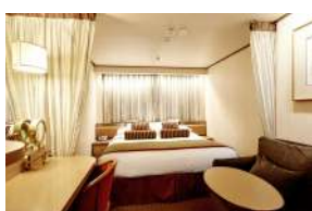
Εσωτερική κατηγορίας IB