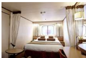
Εξωτερική με παράθυρο με περιορισμένη θέα κατηγορίας XBO