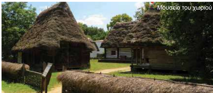
Μουσείο του χωριού

Μετά το πρωινό αναχώρηση για τα θρυλικά Καρπάθια. Αφού διασχίσουμε την κοιλάδα του ποταμού Πράχγβα φτάνουμε στην Σιναΐα, το μαργαριτάρι των Καρπαθίων, όπου θα επισκεφτούμε το παλάτι Πελες, θερινή κατοικία του βασιλιά Καρόλου, του Ιου Βασιλιά της Ρουμανίας. Στη συνέχεια θα δούμε καθοδόν το Μοναστήρι της Σιναΐα, το 1ο κτίριο που κτίστηκε ύστερα από την επίσημη ονομασία της πόλης και έπειτα αναχωρούμε για το Μπραν. Θα επισκεφτούμε τον Πύργο Μπραν, γνωστό ως Πύργο του Δράκουλα, ο οποίος κτίστηκε το 14ο αιώνα ως αμυντικό φρούριο απέναντι στις οθωμανικές επιθέσεις. Συνεχίζουμε με μια σύντομη ξενάγηση στο Μπρασάφ, όπου θα δούμε την παλιά πόλη και τη Μαύρη εκκλησία, γοτθικού ρυθμού, τη μεγαλύτερη σε μέγεθος στη νοτιοανατολική Ευρώπη. Επιστροφή στο Βουκουρέστι, πλημμυρισμένοι από όμορφες εικόνες. Διαν/ση.