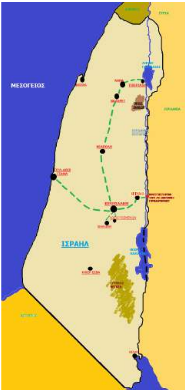
ΧΑΡΤΗΣ ΠΕΡΙΓΗΓΗΣΗΣ ΣΤΗΝ ΙΕΡΟΥΣΑΛΗΜ