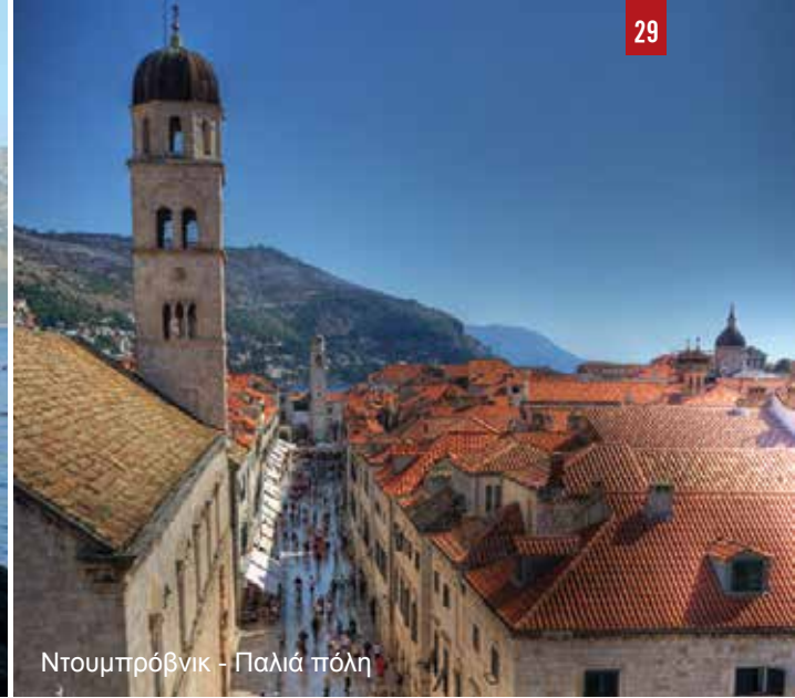
Ντουμπρόβνικ - Παλιά πόλη

Λέοντος Σοφού 8 54625 Θεσσαλονίκη Τηλ. 2310545994, 2310546937, Fax: 2310546937 www.meltravel.gr E-mail: meltravel@meltravel.gr MH.TE 09.33.E.60.00.00930.00