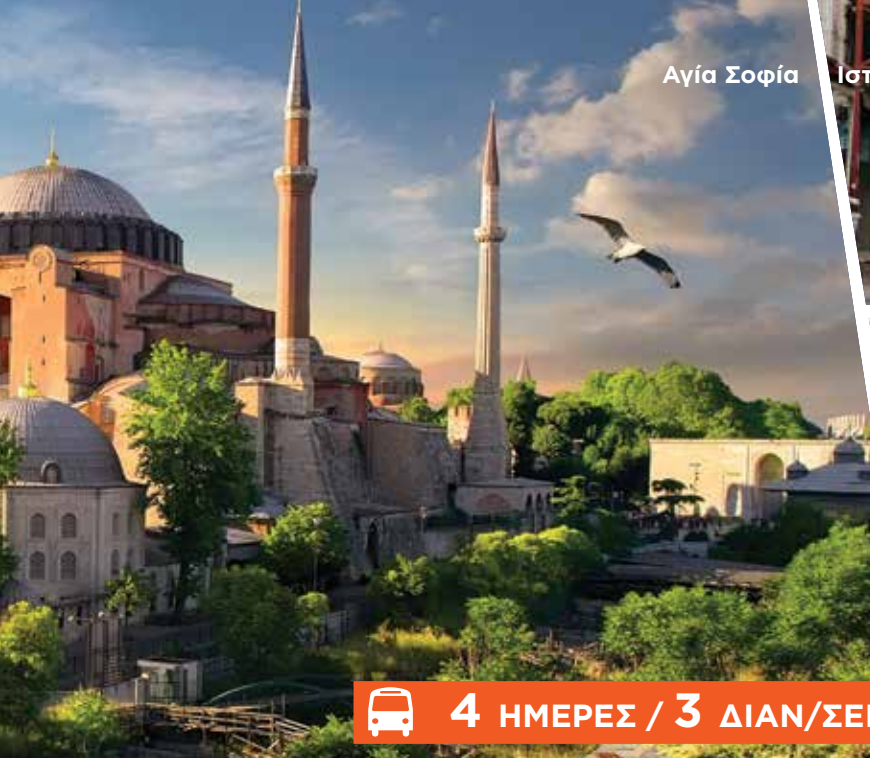
Αγία Σοφία Ιστικλάλ